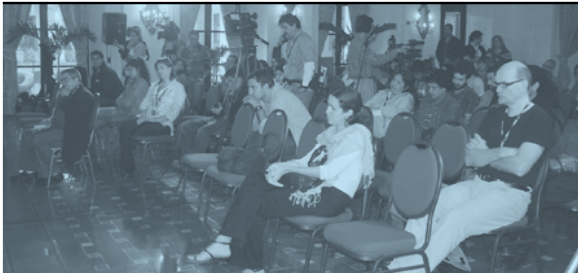
▶ Ambos seminarios sesionarán hoy y mañana, en el Hotel Nacional de Cuba

El nuevo cine latinoamericano afirmó siempre la vocación social de su reflexión. Su ser específico como nuevo cine ha estado definido también por un estar : en qué lugar está situado políticamente en la hora.