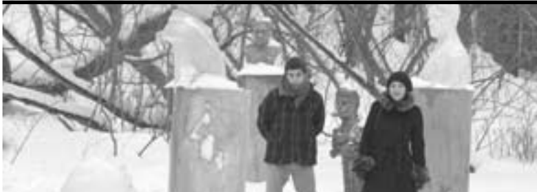
► Dieci inverni

Ese año 1964 en que Narboni reseñaba esos dos importantes títulos, nació en Livorno, en la Toscana, alguien que en un futuro se convertiría en un abanderado de la nueva generación de cineastas italianos: Paolo Virzì. Descuella en la muestra programada anualmente en el certamen habanero como una suerte de panorámica o balance de la más reciente producción, su última cinta: La prima cosa bella (2010). Fue galardonada con el premio David di Donatello en las categorías de Mejor Guión y Mejores Intérpretes Protagonísticos (Micaela Ramazzotti y Valerio Mastrandrea), aunque aspiró, entre otras candidaturas, a la estatuilla al Mejor Filme. La reconciliación con un pasado tumultuoso por un flemático profesor frente a la postura de una mujer desafiante de los pronósticos médicos, es el tema central abordado. El Sindicato Nacional de Periodistas de Cine italianos entregó su premio Nastro d'Argento compartido a las actrices Stefania Sandrelli y Micaela Ramazzotti, por sus papeles principales. A este realizador, distinguido también con el Nastro