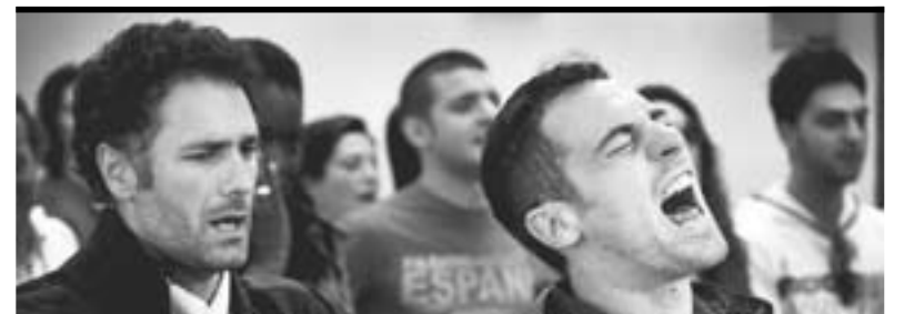
► La nostra vita