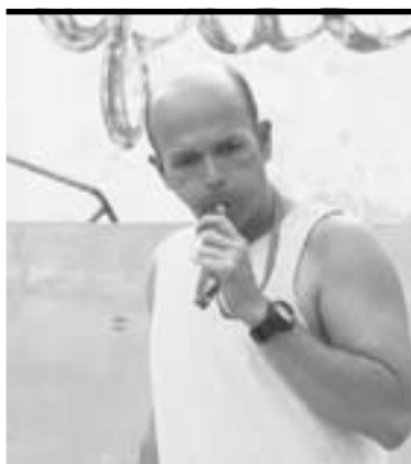
► Los bañistas