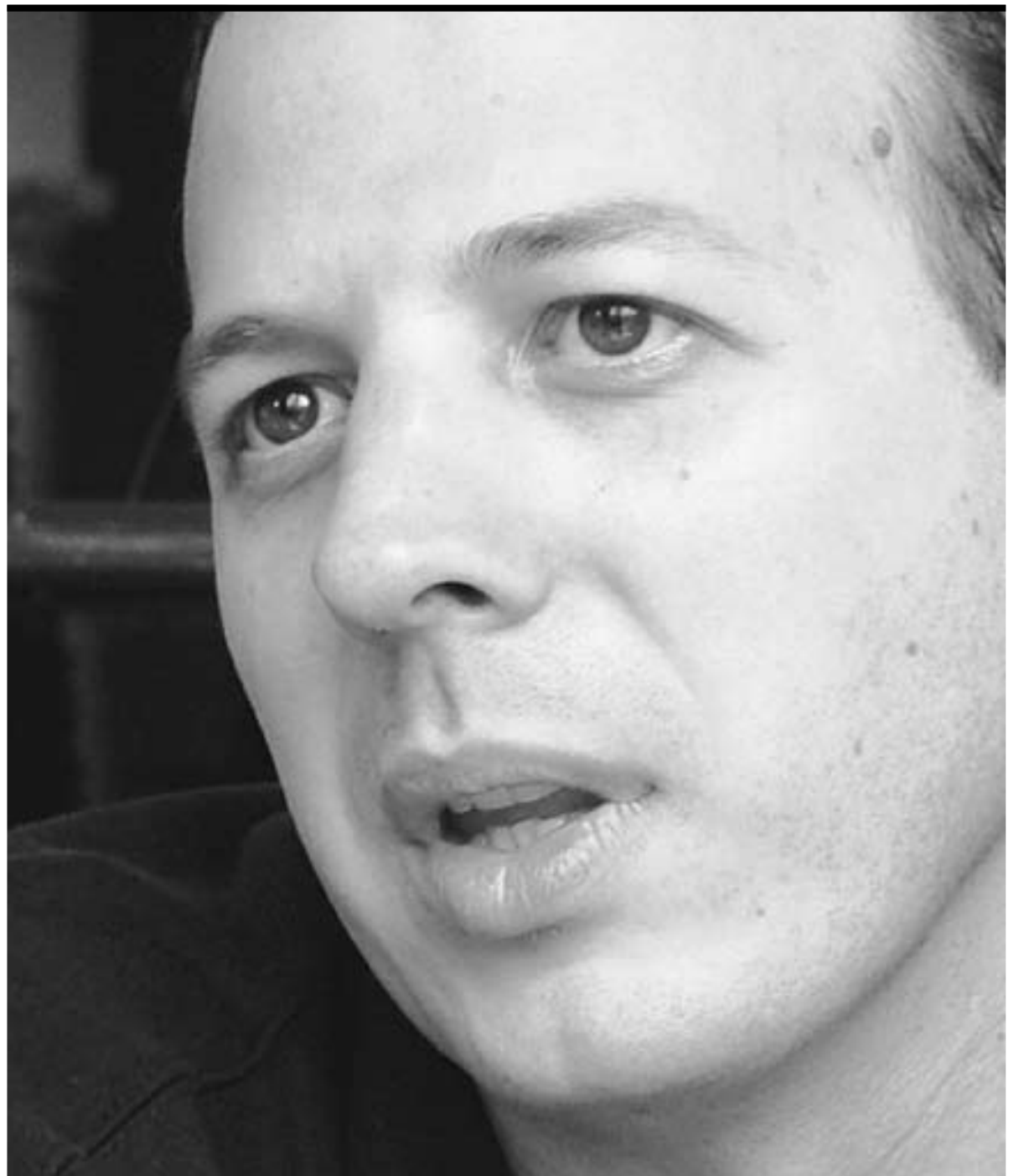
► Director del corto El cura Nicolás colgado, uno de los diez que conforman el filme Revolución .

Sí, la película fue la ganadora al Mejor Largometraje en mi país en el género ficción, también en el Festival Internacional de Cine de Morelia, jurado que, para mi