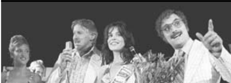
► La prima cosa bella

d'Argento, debemos obras como La buena vida (1994), Vacaciones de agosto (1996), Ovosodo (1997), laureada en Venecia, Besos y abrazos (1999) y Mi nombre es Tanino (2002) entre otros.