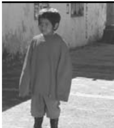
► Ring ring